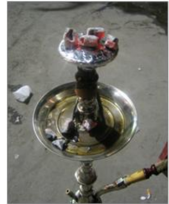
I Tripolis Medina kan du uppleva den klassiska orienten