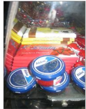
Danska och norska varor är bojkottade men ABBA går bra.