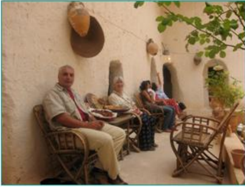
Berberbergen har sin egen arkitektur med underjordiska bostäder och kollektiva sädesmagasin