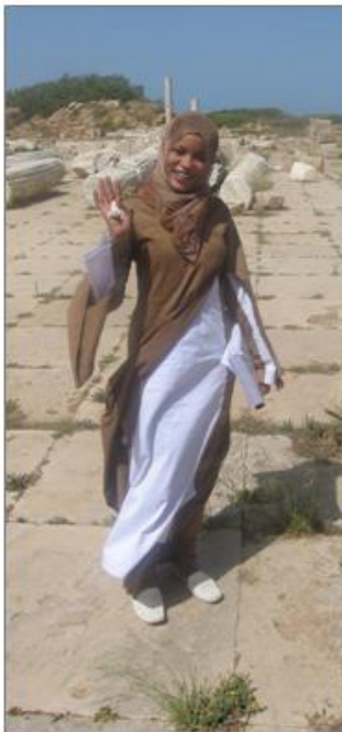
Den libyska kvinnan kan ha sin egna stil bara sjalen är på.