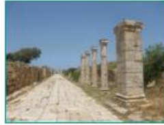
Men det har funnits en tid före Kadaffi