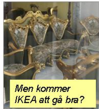
Men kommer IKEA att gå bra?