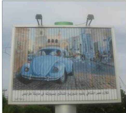
Hur många arabledare får plats i en Folkvagnsbubbla? Svart!