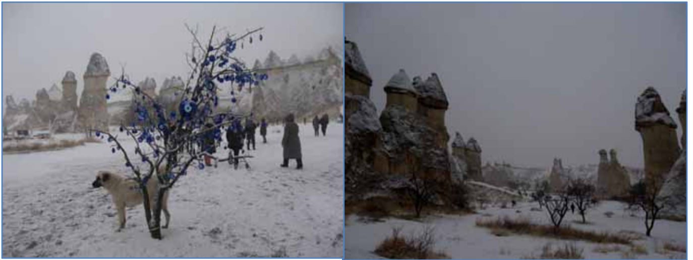
Vi kom nu upp till vintern, men snölagret gav en speciell skärpa åt landskapets säregna konturer