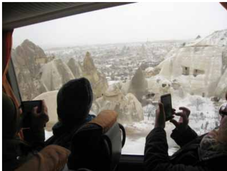
Ibland verkade detta grott- och topplandskap oändligt