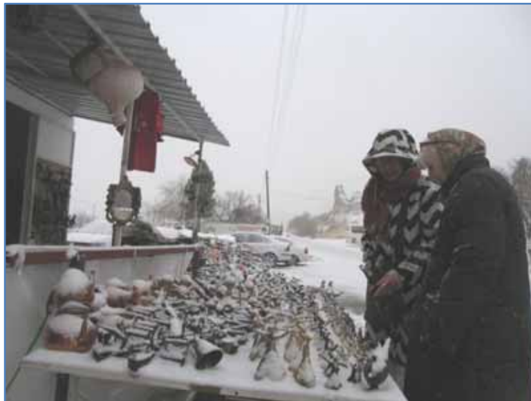
Trots snölagret var kommersen i full gång